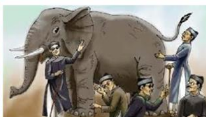
Thầy bói xem voi (13)