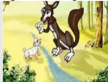
Chó Sói và cừu (11)