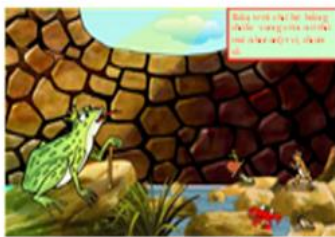
Ếch ngồi đáy giếng (15)