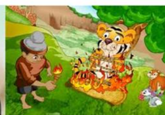
Trí khôn của ta đây (15)