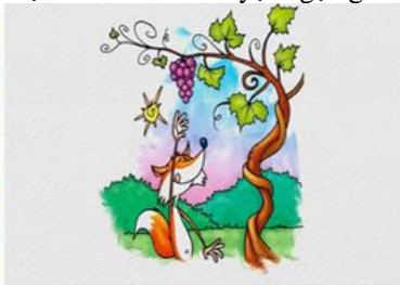
Con cáo và chùm nho (15)