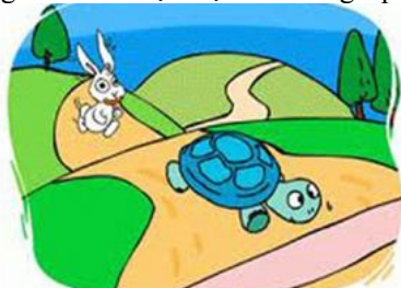
Thỏ và Rùa (8 chữ cái)

+ Ví dụ 2: Ghép tranh với tác phẩm truyện ngụ ngôn - GV có thể đưa ra các bức tranh liên quan đến các truyện ngụ ngôn để HS nhận diện. HS nào ghép được tranh với tên truyện ngụ ngôn đúng nhiều nhất sẽ là người chiến thắng.