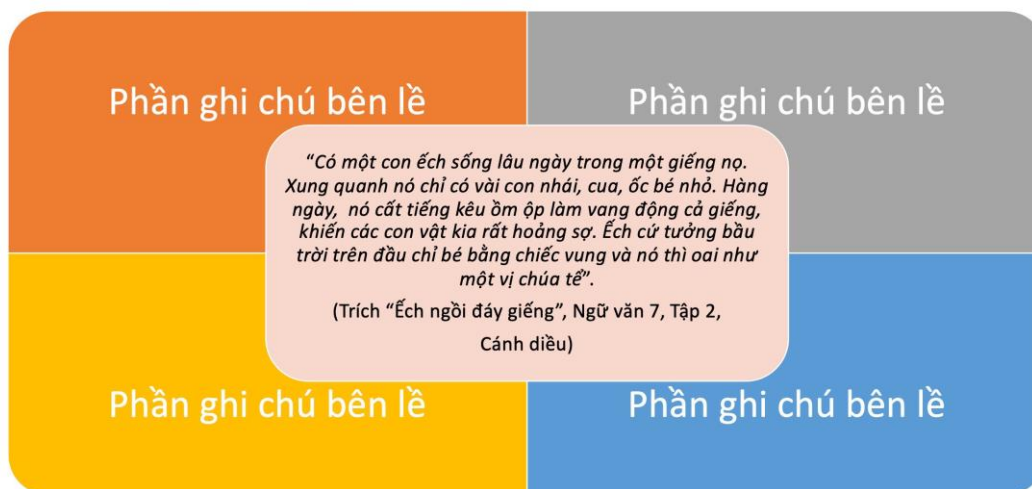
Hình 1. Mẫu phiếu học tập theo chiến thuật ghi chú bên lề

GV có thể sử dụng mẫu phiếu học tập sau: